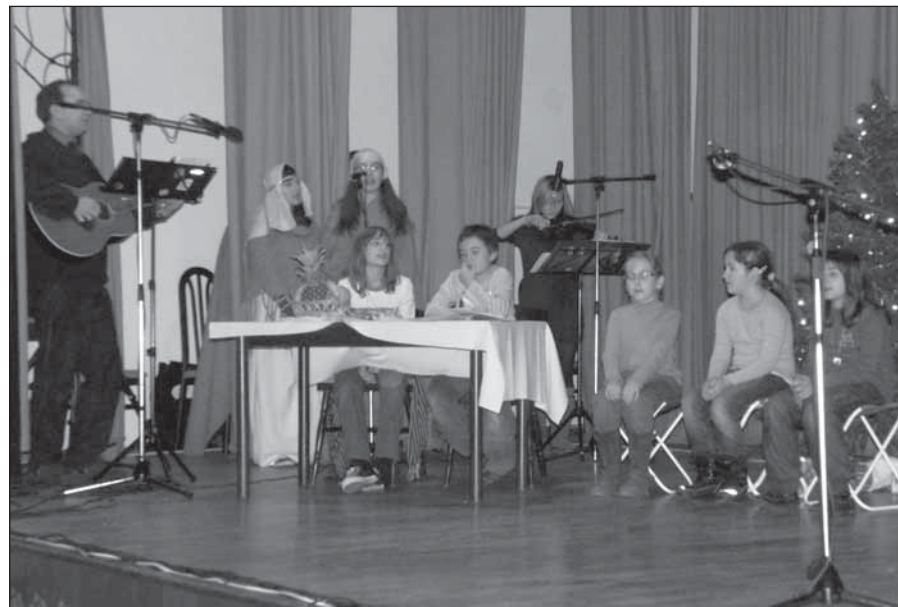
■ Vystúpenie detí v Kultúrnom dome v Ostrove.

noviny, ktoré funguje v spolupráci s Hnutím kresťanských spoločenstiev detí – eRko. Ďakujeme všetkým, ktorí prispeli a podporili týmto rozvojovými projektami v Afrike.