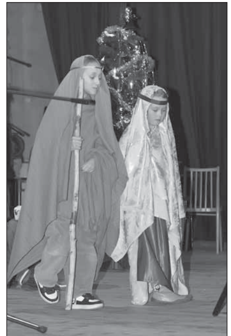
■ Vianočné predstavenie detí v Krakovanoch.

Počas vianočného obdobia sa uskutočnili dve podujatia. Prvým bolo detské vianočné predstavenie, ktoré deti predviedli v kultúrnych domoch v Ostrove aj v Krakovanoch, a druhým bolo už tradičné koledovanie Dobrej